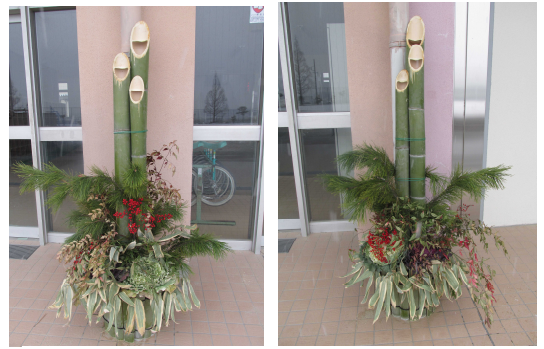
今年もおやじの会の皆さんが、昇降口に立派な門松を飾ってくださいました

1月7日(月)始業式。新たな年を迎え、張り切って登校した児童はどの顔もこの1年を頑張ろうと希望に満ちあふれていました。教室では冬休みの楽しい思い出と今年1年目標を笑顔で話す姿が見られました。この1年、子どもたちが充実した日々を過ごせるよう、職員一丸となって教育活動に取り組みます。本年も保護者の方々のご理解とご協力をよろしくお願いします。市内小中学校では、インフルエンザが流行しています。睡眠時間の確保、手洗い・うがいなどの予防にご協力をお願いします。