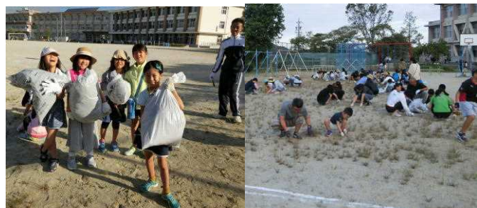
昨年度の除草作業の様子