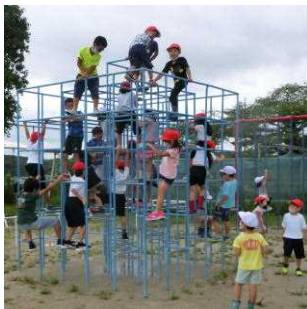
ジャングルジムで楽しむ子どもたち

日々、発表される感染者数の増減に不安を覚えつつも、新学期に向け、職員間で「手洗い」「換気」「咳エチケット」等による感染予防、「新しい生活様式」の周知・徹底について再確認をしました。本日、長久手市教育委員会より「新型コロナウイルス感染症の対応にかかわるガイドライン」を配付しましたのでご確認ください。